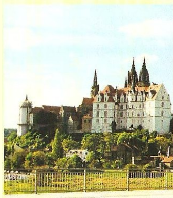
Meißen, Albrechtsburg und Dom